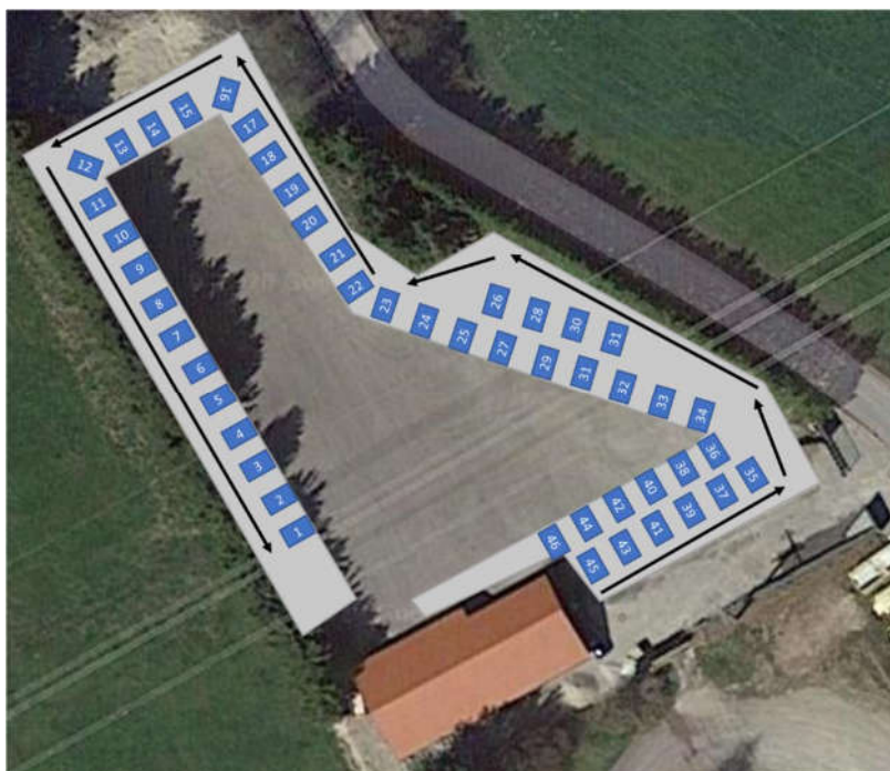
Anzahl der Bereiche mit Sitzplätzen kann abweichen, je nach Aufteilung auf dem Gelände