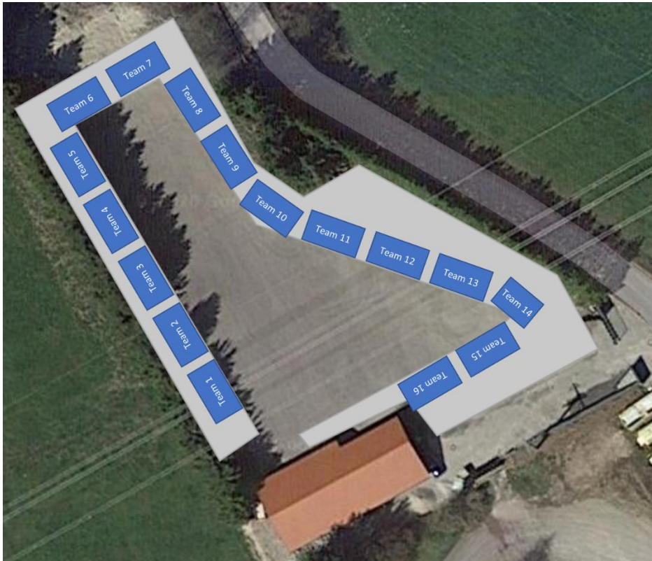
Anzahl der Bereiche kann abweichen, je nach Aufteilung auf dem Gelände